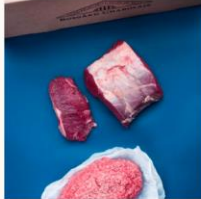
Herkkupaketti 15 kg (kanta-asiakkaile -3%) 350.00 €