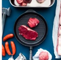
Grillipaketti, 13 kg (Kanta-asiakkaile -7%) 300.00 €