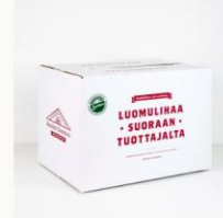
Jauhelihapaketti 15 kg (kanta-asiakkaile -5%) 215.00 €