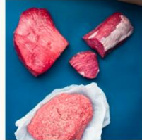
Peruspaketti 15 kg (kanta-asiakkaile -11%) 280.00 €